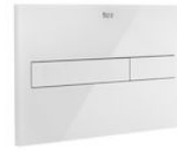
PL7 DUAL (ONE) - Placa de accionamiento con descarga dual con acabados cristal