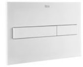
PL7 DUAL (ONE) - Placa de accionamiento con descarga dual con acabados mate