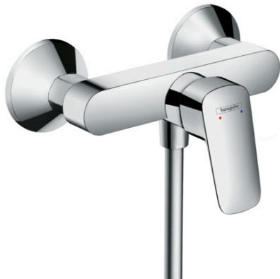
Ilustración del producto