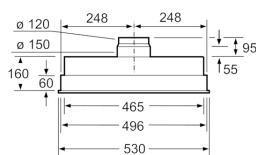
Dimensiones en mm