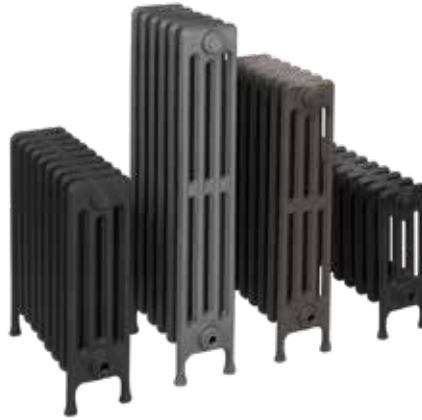
*Imagen de muestra de ejemplos de acabado final, una vez pintado sobre la imprimación y montados los elementos con patas en los extremos.

Soporte o pies de apoyo, tapones y reducciones con rosca derecha o izquierda y juntas.