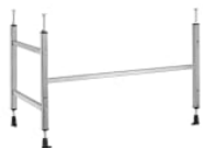
Elemento de instalación para faldón en bañeras sin hidromasaje standard