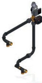
Kit hidráulico SRJ1 (HFS 30 / HFS 40 / HFS 50)