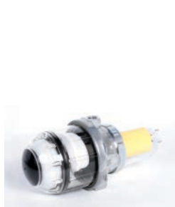
Filtro con desgasificador (Tiger Loop)