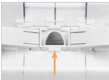
Boca de aspiración

Optimiza la aspiración con un caudal superior, puede ser utilizada con una bomba de velocidad variable, velocidad rápida.